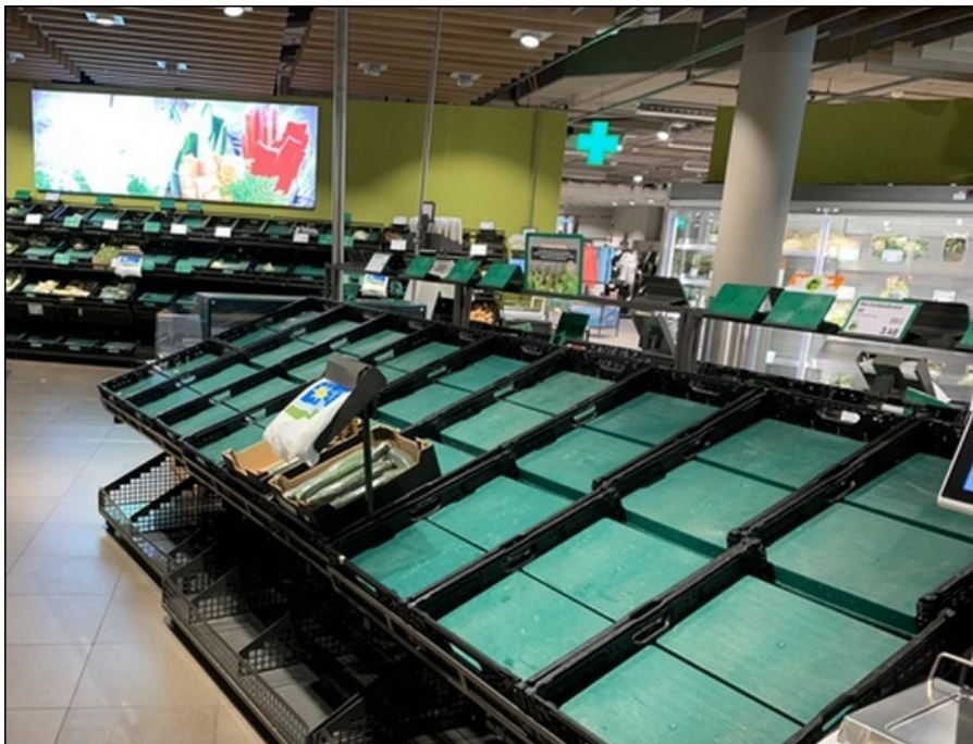
Ein ungewöhnliches Bild für Schweizerinnen und Schweizer: Leere Regale.