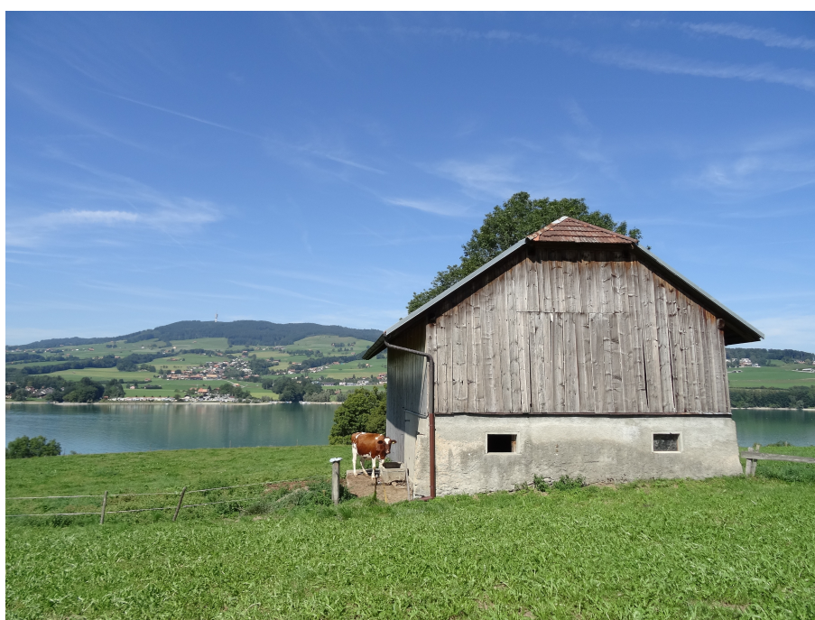
Le Lac de la Gruyère et le Gibloux vus d'Hauteville