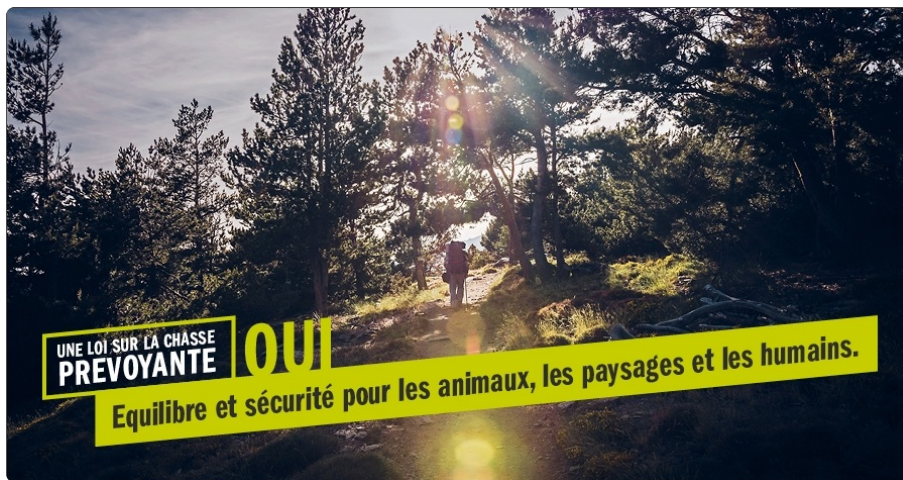
Pour une loi prévoyante sur la chasse: Oui le 27 septembre. (Image m&D)